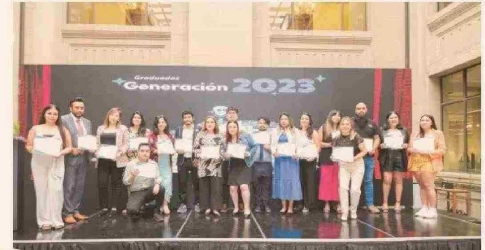
Ceremonia de graduación Curso La Ciudad de las Oportunidades 2023.

capacitación también en conjunto entre el MIPP y el Banco Central, diseñada para todo tipo de público que quiera aprender sobre economía y finanzas personales. Bajo el lema de "Educación Financiera para todos", este curso abrió hace un par de semanas su primera versión con un cupo para 1.000 participantes.