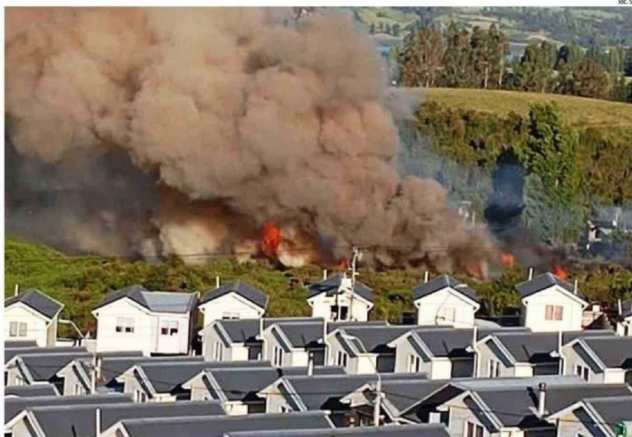
LAS LLAMAS ESTUVIERON A CERCA DE 10 METROS DE LAS VIVIENDAS DE LA VILLA MIRADOR 5, EN EL SECTOR ALTO DE CASTRO.

Junto con ello, en forma paralela se constituyó en el