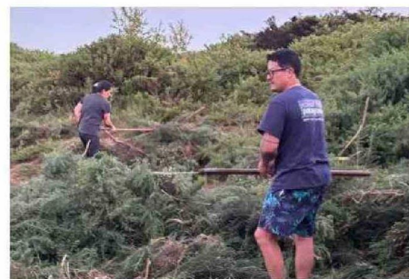
VECINOS TRABAJANDO EN CORTAR PARTE DE LAS MALEZAS.