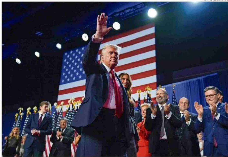
DONALD TRUMP FESTEJÓ EN FLORIDA JUNTO A SU ESPOSA MELANIA Y SUS COLABORADORES.

“Mucha gente me ha dicho que Dios me salvó la vi-