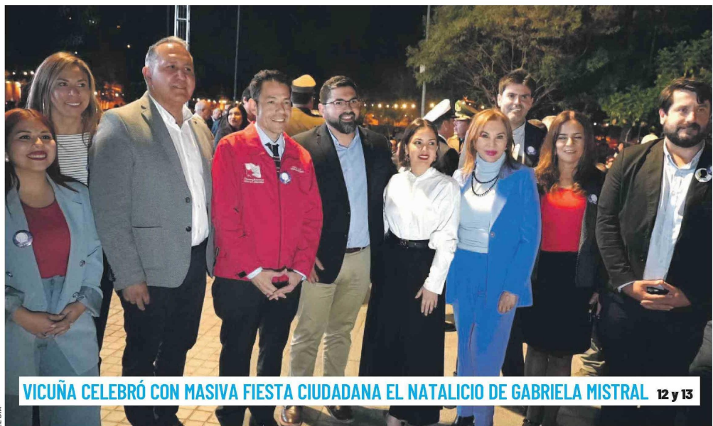
VICUÑA CELEBRÓ CON MASIVA FIESTA CIUDADANA EL NATALICIO DE GABRIELA MISTRAL 12 y 13