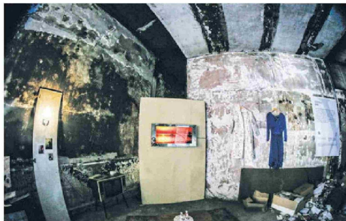
► Arriba, uno de los talleres que se realiza en las dependencias del Museo Violeta Parra. Abajo, parte de la exposición 20 años de la compañía Teatro Niño Proletario.

Guadalajara, organizado por la Universidad de Guadalajara. "La exposición se llama Recolectoras , y es de Violeta Parra y Mon Laferte", revela.