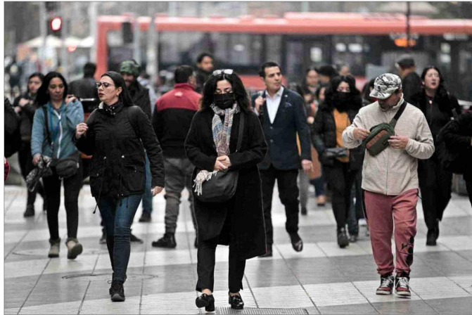
El estudio analiza la desaceleración del crecimiento económico del país en los últimos años, donde se pasó de una variación real del 9,2% en 1995 a un 3,9% en 2018 y a un 0,2% en 2023.