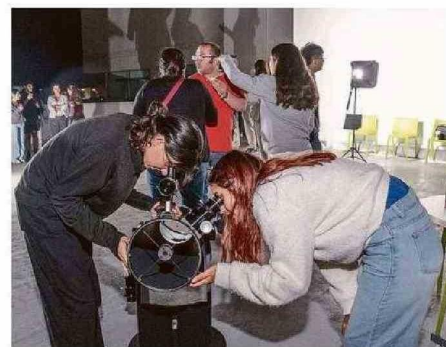
TAMBIÉN MEDIANTE EL USO DE TELESCOPIOS.

mos la suerte de tener un cielo despejado y con poca turbulencia atmosférica". Gracias a ello, los participantes lograron observar los planetas Marte, Júpiter, Saturno y Venus.