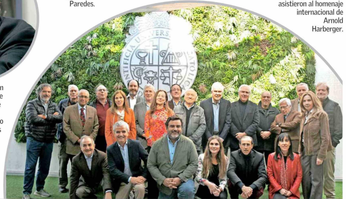
Académicos y economistas asistieron al homenaje internacional de Arnold Harberger.