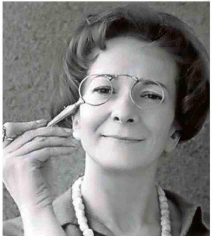
LA AUTORA RECIBIÓ EL PREMIO NOBEL DE LITERATURA EN 1996.

Porque los felinos de Szymborska se quejan de la partida de su dueño: "Morir, eso no se le hace a un gato. /Porque qué puede hacer un gato /en un piso vacío. /Trepas por las paredes. /Restregarse entre los muebles. /Parece que nada ha cambiado /y, sin embargo, /ha cambiado", señala la autora encarnada en el