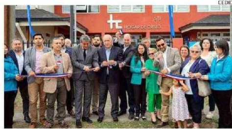
LAS AUTORIDADES Y BENEFICIADOS EN LA INAUGURACIÓN DE LA OBRA.

EN OSORNO. La obra demandó una inversión regional de $4 mil millones.