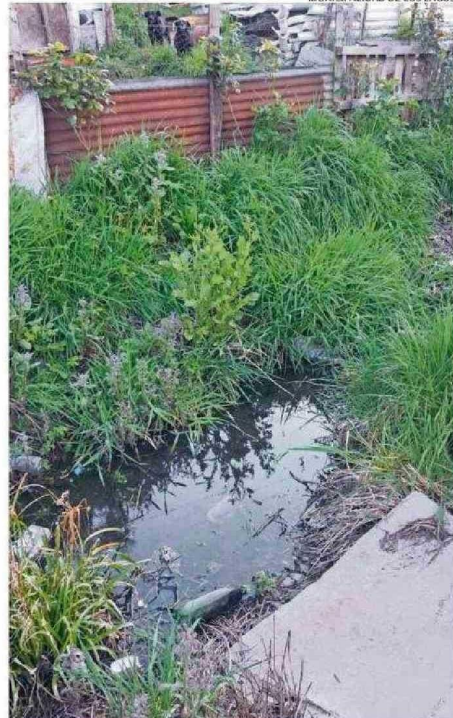
DESECHOS Y ROEDORES MUERTOS: LA REALIDAD DIARIA EN LAS LAJAS.