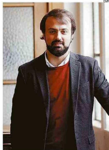
SHARP DESCARTA CUALQUIER SITUACIÓN ILÍCITA.

"Espero que con la misma energía y objetividad (...) se investiguen aquellas cosas que descargan de responsabilidad a mi imputado".