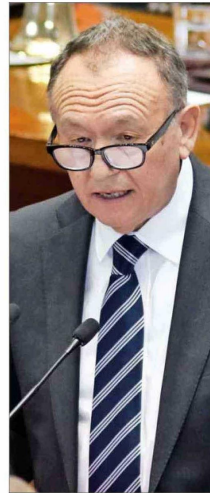
El presidente del Senado, José García R. (RN).

fue captado por un pasajero del avión que lo transportó a Caracas dando un mensaje en donde señaló que “independiente de que no nos hayan dejado entrar hoy vamos a seguir luchando con el pueblo bravo venezolano porque hay que defender la libertad”.