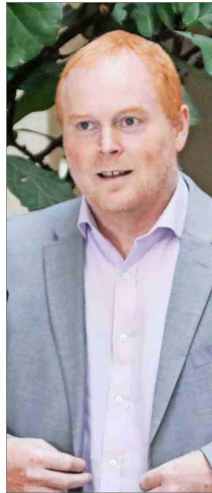
El senador Rojo Edwards.