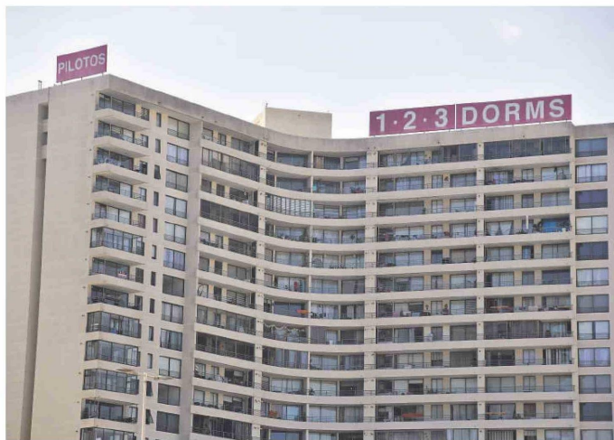
Más de cien mil viviendas había en venta a fines del año pasado en el país.

El beneficio no sería aplicable a compraventas de promesas celebradas con anterioridad al 31 de diciembre de 2024 ni a créditos renovados. El proyecto de ley -resulta-