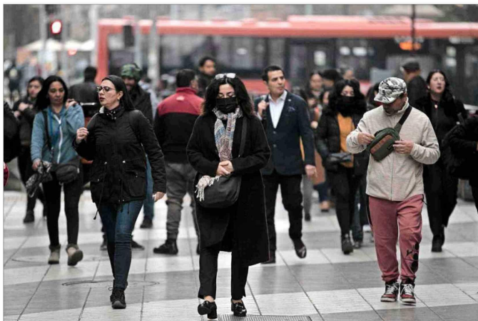
El estudio analiza la desaceleración del crecimiento económico del país en los últimos años, donde se pasó de una variación real del 9,2% en 1995 a un 3,9% en 2018 y a un 0,2% en 2023.