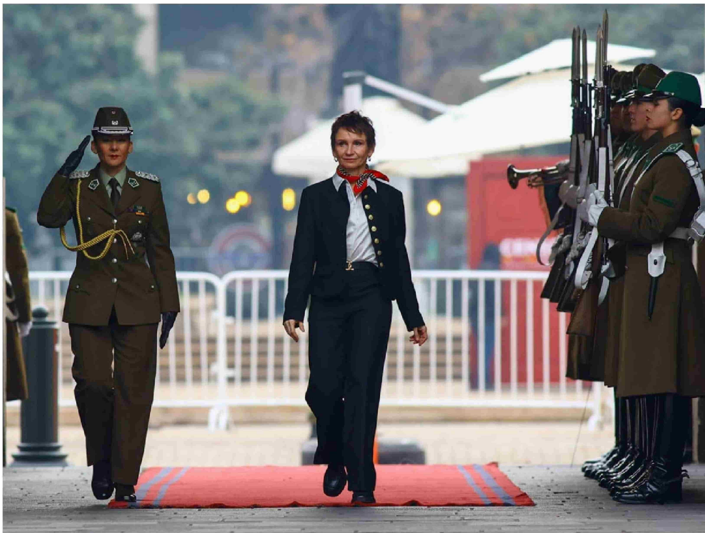
► «(El libro) Se hizo fundamentalmente en el período justo anterior a que la ministra (Tohá) asumiera el cargo», dice el exministro Álvaro García.

Los resultados son que los grandes cambios que el país requiere no se hacen. El mejor ejemplo de ello es la reforma de pensión. Ya vamos en el tercer gobierno que trata de impulsarla sin éxito. Algo parecido ha ocurrido con el pacto fiscal. Varios gobiernos, de distintos signos políticos, han impulsado cambios que no han llegado a puerto. Hay un tercer elemento, pero más ajeno al diálogo, que es nuestro sistema político. Se ha polarizado enormemente y se ha fracturado en una enorme cantidad de pequeños partidos políticos. Sumado a la desconfianza ciudadana, se ha convertido en un sistema muy ineficaz para lograr acuerdos y resultados. Es necesaria una reforma política y acompañar el diálogo político con diálogo social. En muchas oportunidades, en Chile y fuera de Chile, el diálogo social ha facilitado la construcción de acuerdos políticos.