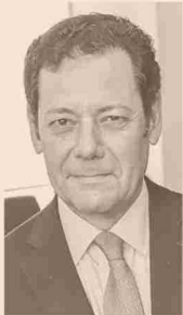
JOAQUÍN VILLARINO PDTE. EJECUTIVO CONSEJO MINERO

“El mundo está viviendo un apetito tremendo por minerales críticos y aún no está claro de dónde saldrán esos minerales por las dificultades que hoy vivimos en el mundo para el desarrollo de nuevos yacimientos y así generar una mayor producción”, dijo el presidente del directorio de Codelco, Máximo Pacheco.