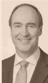
JOHN MACKENZIE CEO DE CAPSTONE COPPER

“Se ha comenzado a dar una serie de factores positivos para la inversión minera. El cierre de la discusión sobre el royalty y el proceso constitucional, habilitan, en general, un mejor panorama para la reactivación de las inversiones en el país”.