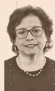
AURORA WILLIAMS MINISTRA DE MINERÍA

“El impacto de un nuevo ciclo de inversión no se sentirá de inmediato debido a los largos tiempos de ejecución de los proyectos. Se necesita avanzar en disminuir la burocratización en el trámite de permisos, junto con generar clara y decididamente un clima favorable a las inversiones”.