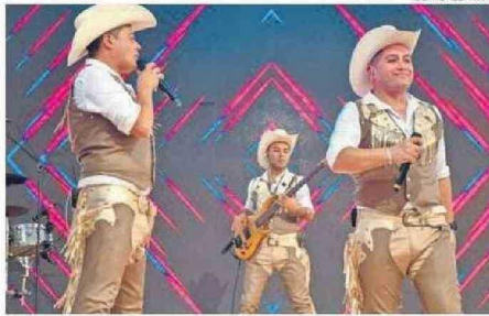
EL GRUPO ZÚMBALE PRIMO SERÁ PARTE DE LA GIRA.

Los shows por el país comienzan con su primera tanda por la zona norte del país, en una gira que irá del 15 al 19 de octubre.