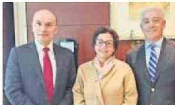
LA MINISTRA DE MINERÍA, AURORA WILLIAMS.