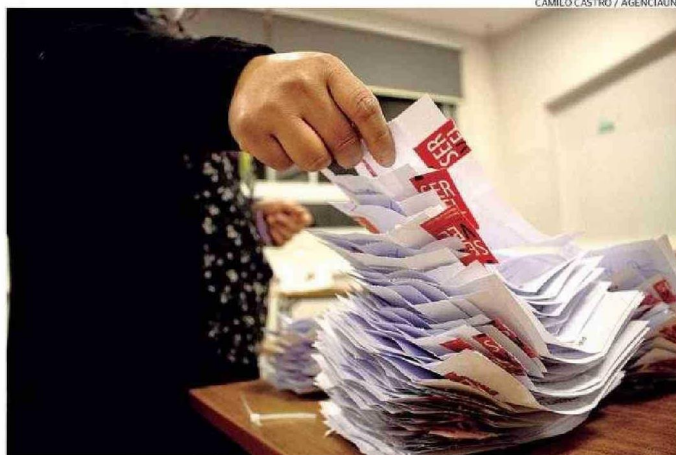
EN OCTUBRE SE DESARROLLARÁN LAS VOTACIONES MUNICIPALES.

Y si bien menciona que los comicios de alcalde también sirven para sondear, su sistema es de votación directa. "La