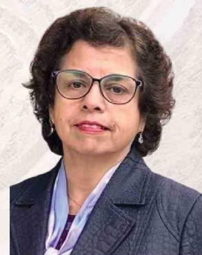
Aurora Williams Ministra de Minería

Chile, con su riqueza mineral, se presenta como un actor clave en este escenario. A través de este acuerdo con la UE, el país no solo refuerza su posición en el mercado global, sino que también contribuye de manera significativa a los esfuerzos internacionales para reducir las emisiones de gases de