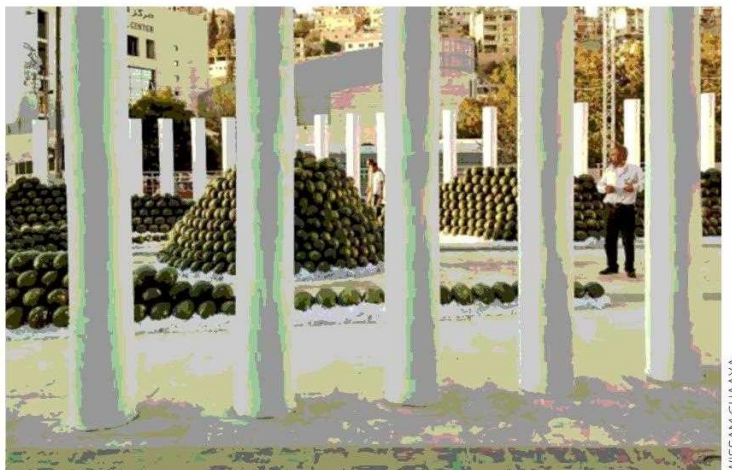
Decano del MIT, Sarkis combina su trabajo académico con encargos privados, instalaciones y publicación de libros.

ras, materiales. Me interesa crear espacios impredecibles, obras sin tiempo y del tiempo, que seduzcan y provoquen querer que diga algo más; solo así perdurarán”.