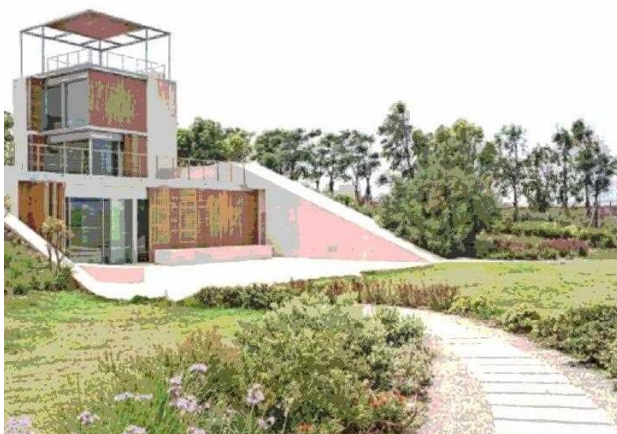
En la costa de Aamchit, este proyecto consta de cuatro casas y la rehabilitación de otras antiguas y del paisaje.