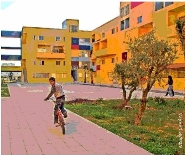
De 2008 es este conjunto para una comunidad de pescadores en el Líbano, organizado en torno a un espacio abierto e inundado por el color.