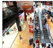
"Un año de escaso crecimiento para el comercio" proyectan en Marcas del Retail.

Pese a la recuperación, los gremios minoristas advierten débiles señales de crecimiento para 2025. "Preveemos un 2025 con una desaceleración del crecimiento sectorial", dice Vial.