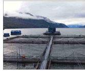
Gremios piden destrabar las barreras regulatorias contra la industria.