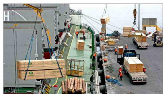
Las exportaciones forestales llevan una década estancadas, sin lograr romper el techo de los US$ 6.000 millones.

El timonel del gremio agregó que problemas logísticos a nivel local e internacional han afectado los tiempos de entrega.