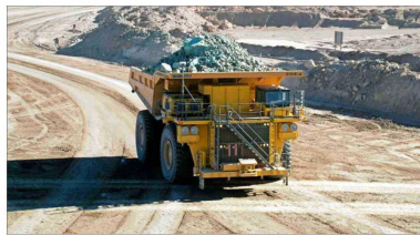
La Sonami cree que la industria se mantendrá estable y que crecerá en torno a 3% el próximo año.

En ese sentido, desde el Consejo Minero resaltan que "la demora en los procesos de aprobación es una barrera significativa para que los proyectos se materialicen y avancen a la velocidad necesaria, concretando su aporte a las regiones y a nivel nacional". Pese a que valoran los avances