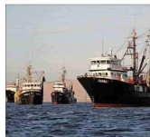
Las modificaciones al fraccionamiento preocupan al rubro.

Ambos gremios instaron a las autoridades a destrabar las barreras regulatorias que impiden el crecimiento del sector para continuar compitiendo contra Noruega en esta industria.