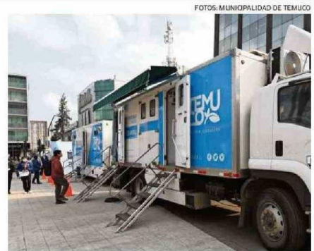
LA FLOTA DE VEHÍCULOS DEL PROGRAMA DE SALUD EN LOS BARRIOS FUE EXHIBIDA AYER EN LA PLAZA ANÍBAL PINTO DE TEMUCO.

Asimismo, Neira valoró la alianza estratégica con el Fosis para apoyar a los beneficiarios del programa Familias, Seguridad y Oportunidades, heredero del Programa Puente, que tiene por objetivo entregar una oferta preferencial a las personas