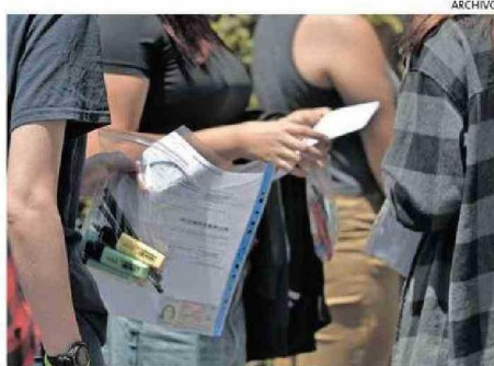
MILES DE ESTUDIANTES RENDIRÁN EL EXAMEN.

(PAES) de invierno, hay directrices claras que pueden ayudar a tener un desempeño idóneo. "Los días anteriores a la prueba, recomiendo