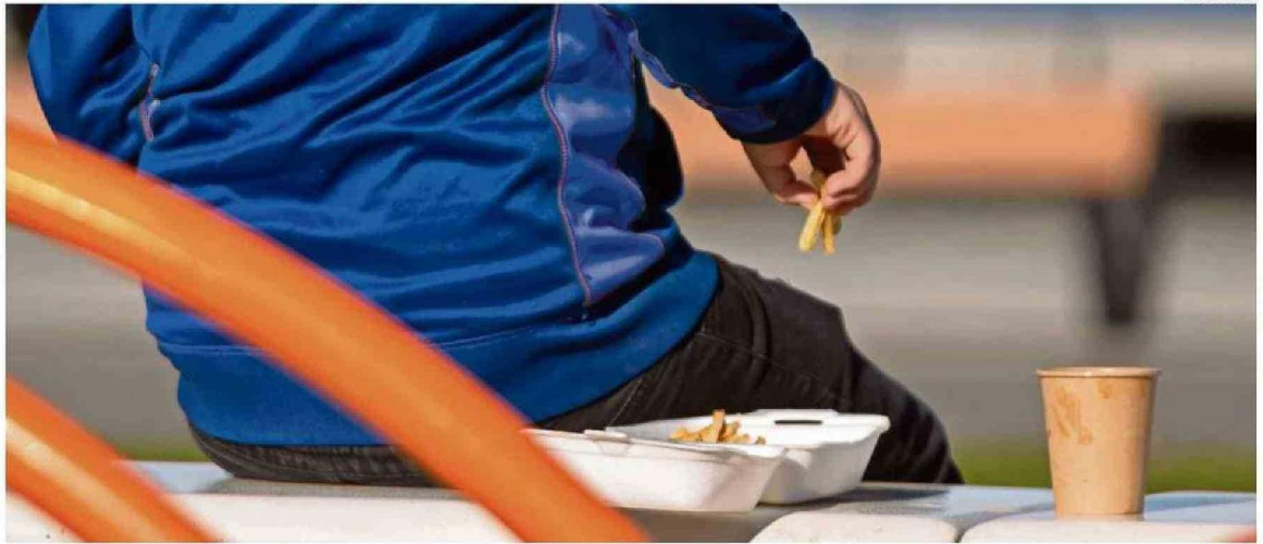
ESPECIALISTAS COLOCAN EL ACENTO EN EL ESFUERZO POR LOGRAR QUE LOS MENORES CAMBIEN SUS HÁBITOS ALIMENTICIOS.

En comparación a la medición de 2022, se indica que la obesidad y obesidad severa disminuyeron de 28,75% a 26,70% (se descarta a los