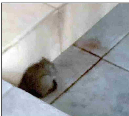
Otra imagen de un ratón en el Colegio Sunnyland.

«Como Seremi de Salud contamos con un plan anual de trabajo de fiscalización, en el que están incorporados los establecimientos educacionales de la región, a fin de realizar labores de vigilancia, inspección y verificación de las condiciones sanita-