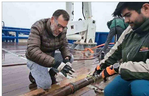
Los investigadores preparan termómetros submarinos de precisión en una sonda que, luego, bajaron para recolectar información de la zona.

des cercanas a los 4 mil metros y el análisis de mapas batimétricos (de la superficie submarina), que se confeccionaron durante la expedición, permitieron descubrir un nuevo volcán submarino al que se llamó informalmente Kénos, que en kawésqar significa "el creador".