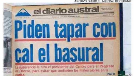
LA CIUDADANÍA IMPLORÓ POR TERMINAR CON EL FLAGELO DEL MAL OLORES.

Crónica El Austral cronica@australosorno.cl