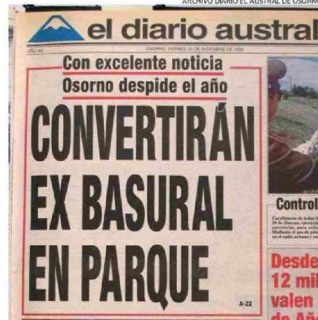
LA INTENDENCIA PROMETIÓ UN PARQUE EN 1993, PERO NO SE CONCRETÓ.

"Si hay una cesión de terrenos, como sería el ex basural, entonces ANFA procedería a la