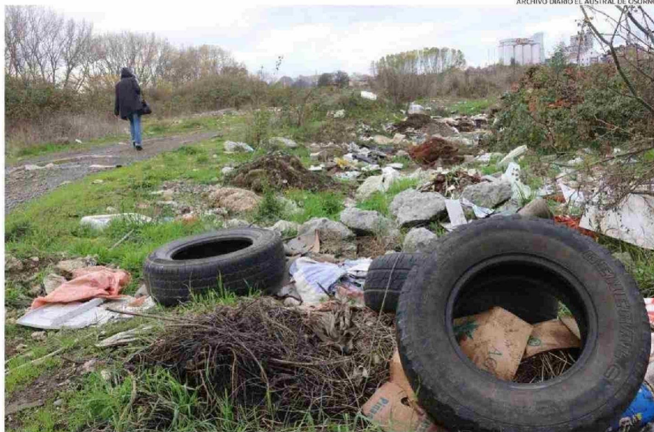
ASÍ ESTABA EL PARQUE EN MAYO DE 2015: ABANDONADO POR EL MUNICIPIO, LLENO DE BASURA Y CON UN MATADERO ILEGAL EN SU INTERIOR.

Después de muchos dimes y diretes, se convino que el mejor lugar, por no existir napas freáticas, era Curaco, en el camino al mar. Un vecino del sector vendió al municipio 40 hectáreas donde se instaló el vertedero de basura que sigue funcionando hasta el hoy día,