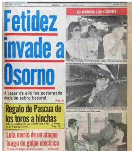
LA SITUACIÓN CON EL BASURAL ERA INSOSTENIBLE PARA 1985.

aunque mega colapsado. Pero sus malos olores, por la gran cantidad de basura de toda la provincia que a diario se descarga, afecta a parte de los habitantes de Rahue Alto y de las inmediaciones, además de los incendios que ha sufrido en los veranos y el derrame de líquidos liviandados a los predios colindantes.