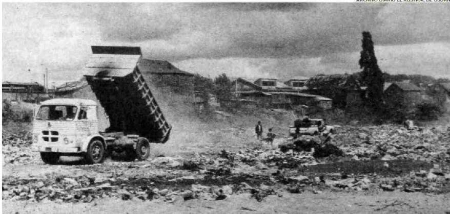
EN LA IMAGEN DE 1982 SE VE A UN CAMIÓN EN PLENA DESCARGA DE BASURA. ERA LLEGAR Y ENTRAR A DEJAR DESPERDICIOS AL BASURAL.

Ayer se abrió al público el tan esperado recinto de recreación en los terrenos donde funcionó hasta 1986 el vertedero municipal. Las autoridades se lucieron en el corte de cinta, pero la verdad es que el área existe gracias al empuje de los vecinos y ambientalistas. Los habitantes de Ovejería soportaron plagas y malos olores para, al fin, encontrar paz.