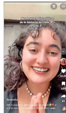
Los videos se titulan "Momentos más caóticos de la historia de Chile".

gación social, entre otros. Al mismo tiempo, recuerda que se han dejado excluidos del relato a las mujeres y los sectores populares. "Esta fecha nos puede servir como recordatorio de lo que tenemos hoy, que es la democracia", agrega.