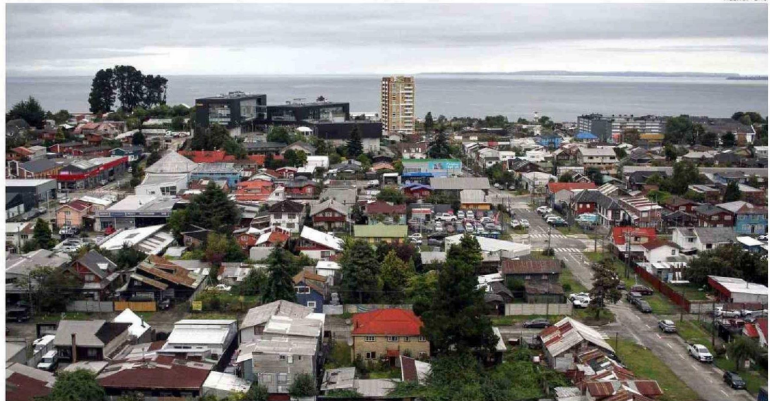
LA NUEVA ADMINISTRACIÓN BUSCA OTORGARLE UN RENOVADO AIRE A LA IMAGEN DE LA CIUDAD, CAPITAL DE LA REGIÓN DE LOS LAGOS.