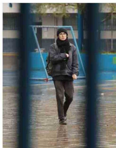
La lluvia no fue obstáculo para que los estudiantes llegaran de manera puntual a las pruebas en la región de O'Higgins.

En la comuna de Rancagua se habilitaron tres locales educativos; mientras que en Santa Cruz se abrió el tercero.