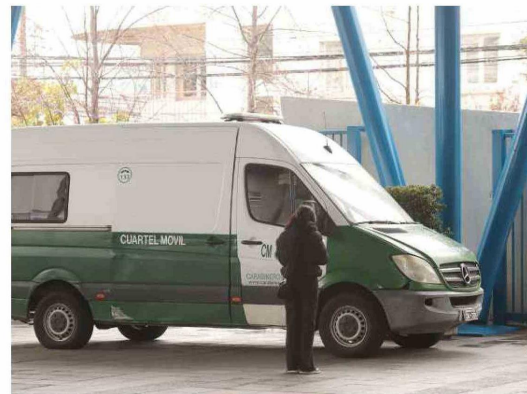
La seguridad fue garantizada en los locales educativos mientras se desarrolla la Prueba de Acceso a la Educación Superior (PAES).

Esta prueba, dirigida solo a egresados y egresadas de enseñanza media, otorga mayor flexibilidad al sistema y disminuye la ansiedad de quienes rinden también en verano. También es importante resaltar que la prueba de Competencia Lectora, de Competencia Matemática 1 (M1) y de Historia y Ciencias Sociales, están compuestas por 65 preguntas; mientras que la de Ciencias contiene 80 preguntas y la de Competencia Matemática 2 (M2), tiene 55 preguntas. Esta prueba a nivel nacional, es dirigida a personas, chilenas o extranjeras, egresadas de la Enseñanza Media en 2023 o en años anteriores y que tengan disponible en línea su Licencia de Enseñanza Media y/o su certificado Anual de curso de egreso (IV Medio, 2° Nivel Medio Adultos, o 3° Nivel Medio Adulto TP), o en su defecto reconocimiento de Estudios realizados en el extranjero. Es importante resaltar, que