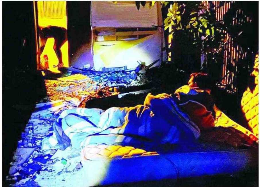
LOS RUCOS IMPROVISADOS EN CUALQUIER RINCÓN DE LAS CALLES SON EL HOGAR DE MUCHAS PERSONAS EN LA REGIÓN.

En Ancud, en la provincia de Chiloé, está el Albergue Público con 20 cupos por 150 días, ejecutado por