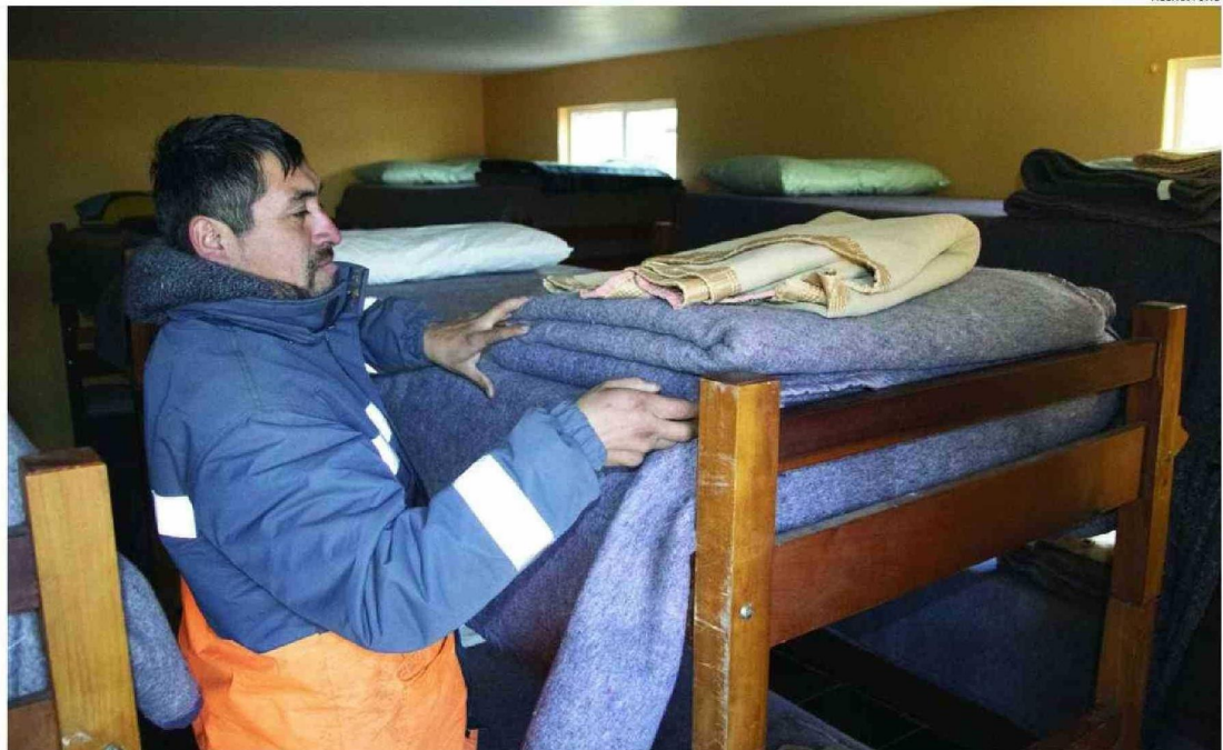
LOS ALBERGUES PÚBLICOS O PRIVADOS, COMO EL LUBICADO EN RAHUE ALTO, AL LADO DE LA PARROQUIA SAN LEOPOLDO MANDIC, SON UNA OPCIÓN PARA PASAR LAS FRÍAS NOCHES.

Según reportes del Midesof, la cifra para 2024 de personas en situación de calle llega a 21.272, donde la mayoría se concentra en la regiones Metropolitana, de Valparaíso y Biobío. En el caso de Los Lagos, está en una posición intermedia, con cerca de 1.500 personas