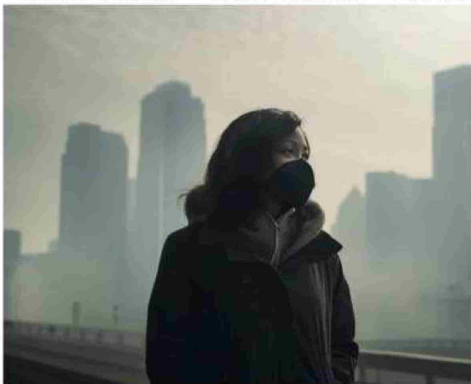
Las personas que cursan un embarazo están entre las vulnerables cuando se exponen a la contaminación por material particulado.