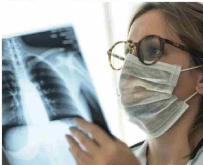
El mayor nivel de contaminación por material particulado sube el riesgo de más muertes prematuras.