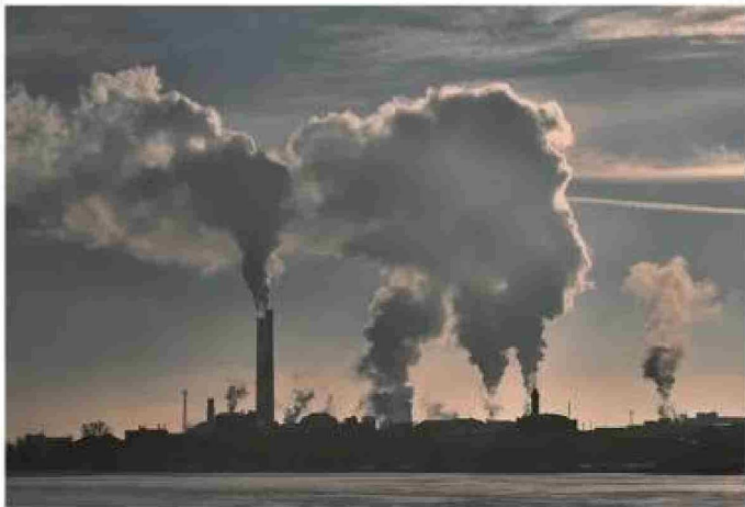
Aún no existe una base de datos global con la contaminación por PM2,5, que sea actualizada periódicamente.