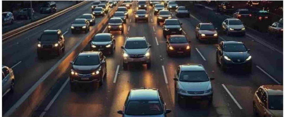
Las partículas PM2,5 son 30 veces más pequeñas que un cabello humano. Estas partículas pueden provenir de los automóviles, camiones, fábricas, quema de madera y otras actividades.

Como integrantes de la comisión, también se en-