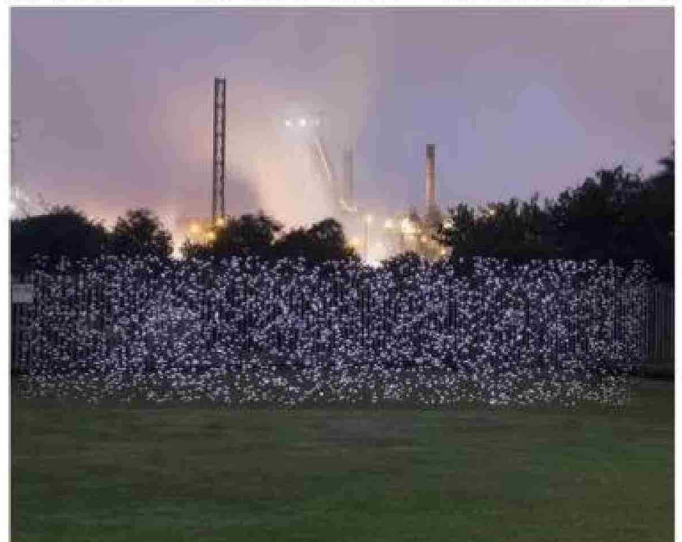
Un sitio de monitoreo de calidad del aire en el Reino Unido.