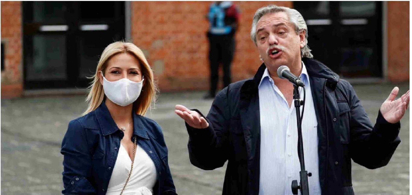
► El entonces presidente Alberto Fernández junto a la primera dama, Fabiola Yáñez.

Tiraje: 78.224 Lectoría: 253.149 Favorabilidad: No Definida