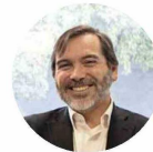
Daniel Concha, director nacional del Senadis.

"Cuando se desarrollan protocolos que contemplan la inclusión de personas con discapacidad, se reduce el riesgo de situaciones adversas y se crea un ambiente