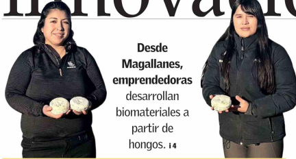
Desde Magallanes, emprendedoras desarrollan biomateriales a partir de hongos. 14

EMPRENDEDOR ESTADOUNIDENSE CHRIS KLAUS VUELVE A APOSTAR POR CONCEPCIÓN: FINANCIA A SEIS STARTUPS DE ESTUDIANTES POR UN TOTAL DE US$ 150 MIL. 14