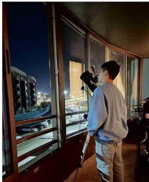
EL ALUMNO DEL LICEO NACIONAL EN UNA DE LAS TANTAS NOCHES JUNTO A SU TELESCOPIO.

Tras la presentación en noviembre pasado, el equipo logró el primer lugar y por esto es que deberán viajar este año al Observatorio de Las Campanas como premio. “En ese momento me gustaría disfrutar y enfocarse en una nebulosa. Ojalá nos permitan enfocarse en una nebulosa”, reflexiona.