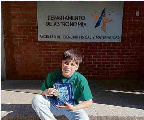
CON SU PREMIO EN LA FACULTAD DE ASTRONOMÍA DE LA UNIVERSIDAD DE CONCEPCIÓN.