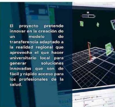
El proyecto pretende innovar en la creación de un modelo de transferencia adaptado a la realidad regional que aprovecha el que hacer universitario local para generar soluciones innovadas que son de fácil y rápido acceso para los profesionales de la salud.