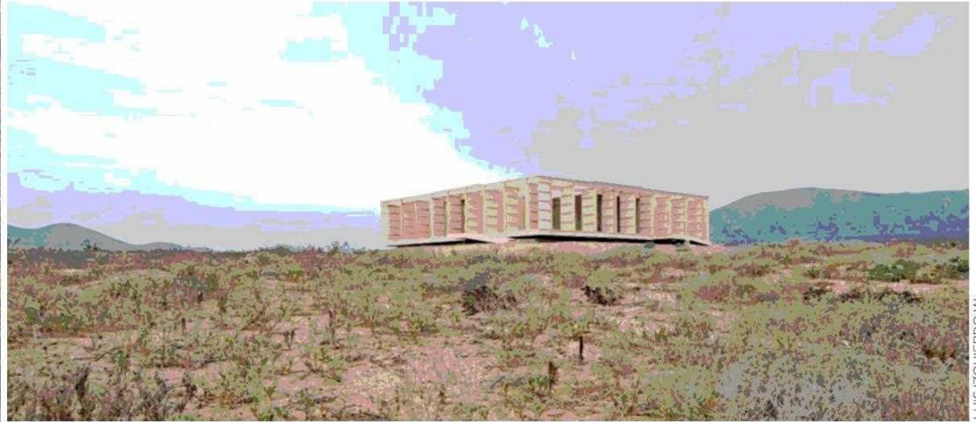
Casa en Morillos, de 175 m 2 , hecha íntegramente en madera de pino sin nudos.