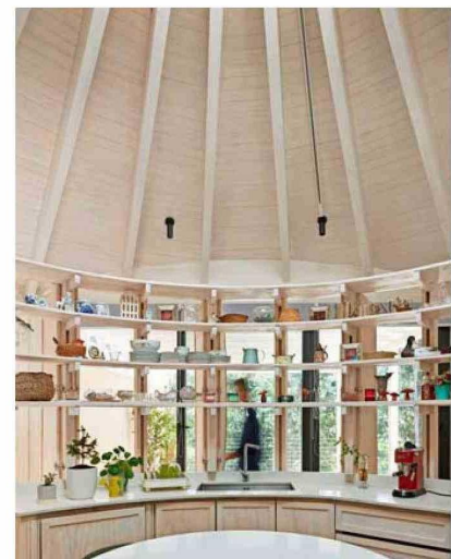
Casa en Nonguén. Estructura de madera laminada Lamitec y revestimientos y puertas de pino finger.