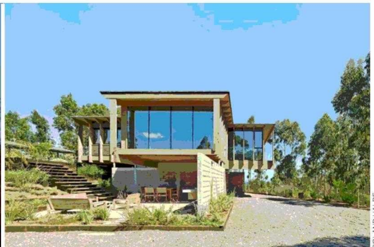
Casa en Pupuya hecha con un kit prefabricado de madera laminada.

lizada diseñados por él. La primera casa que hizo, en Futrono, fue para una clienta a quien le parecía importante vivir más achoclonados, que no costara encontrarse, que los recorridos fueran cortos. Fue algo con lo que él sintonizó. "Me interesó promover los encuentros en los proyectos –sin anular la individualidad–, porque uno se realiza en la vida en conjunto", dice. Luego, llegando del máster en la U. de Columbia, Estados Unidos, conoció a un cliente maderero, y su casa en Morillos la hizo con estructura, revestimientos, ventanas y puertas de madera, como una obra de arte. "Los atributos de este libro (la planta centralizada y la madera) fueron producto de la contingencia, yo simplemente fui tirando el hilo, como el hilo de Ariadna", señala.