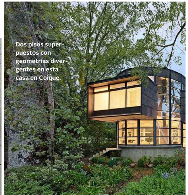
Dos pisos superpuestos con geometrías divergentes en esta casa en Coique.