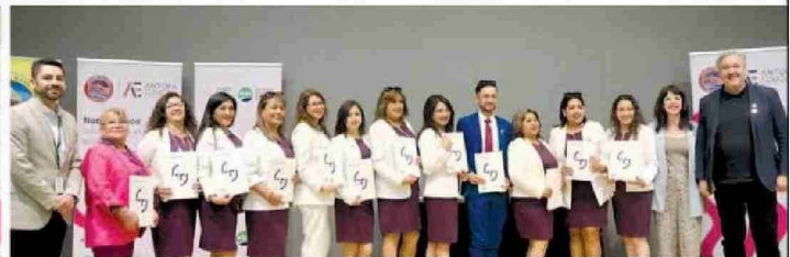
Profesores de la Escuela Valentín Letelier D-131 de Calama reciben sus diplomas TAMK (Universidad de Ciencias Aplicadas de Tampere, Finlandia).