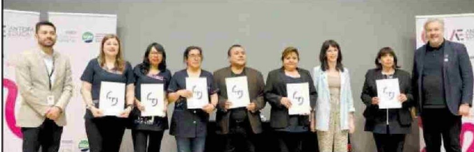
Profesores del Complejo Educacional de Toconao de San Pedro de Atacama reciben sus diplomas TAMK (Universidad de Ciencias Aplicadas de Tampere).