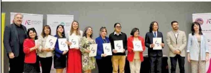
Entrega de diplomas TAMK a profesores de la Escuela Presidente Balmaceda D-48 de Calama.