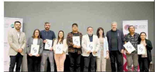
Entrega de diplomas TAMK a profesores del Complejo Educacional de Toconao de San Pedro de Atacama.