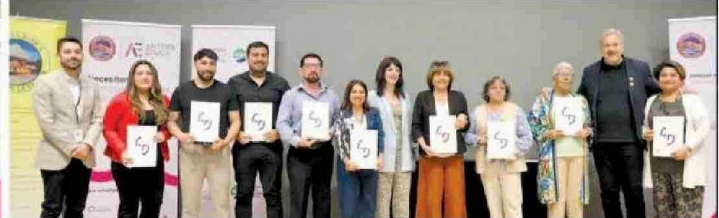
Entrega de diplomas TAMK a profesores del Liceo Técnico Profesional Científico Humanista de María Elena.