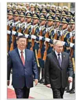
Gobernantes profundizan su "asociación estratégica".

La Unión Europea investiga si Facebook e Instagram generan comportamientos adictivos. | A 14