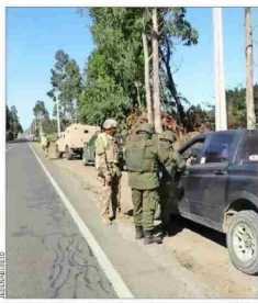
La vigilancia conjunta de carabineros y personal de las FF.AA. opera en las provincias del Biobío y La Araucanía.

► En cambio, las proyecciones de déficit de cobre llevan al alza el valor de la principal exportación nacional. Cochilco eleva su estimación a US$ 4,3 la libra para este 2024. | B 2