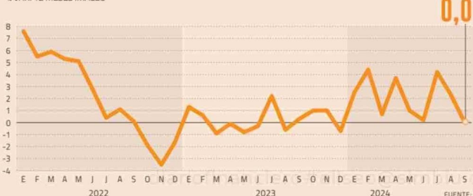
EVOLUCIÓN DE LA ACTIVIDAD ECONÓMICA % VAR. 12 MESES IMACEC