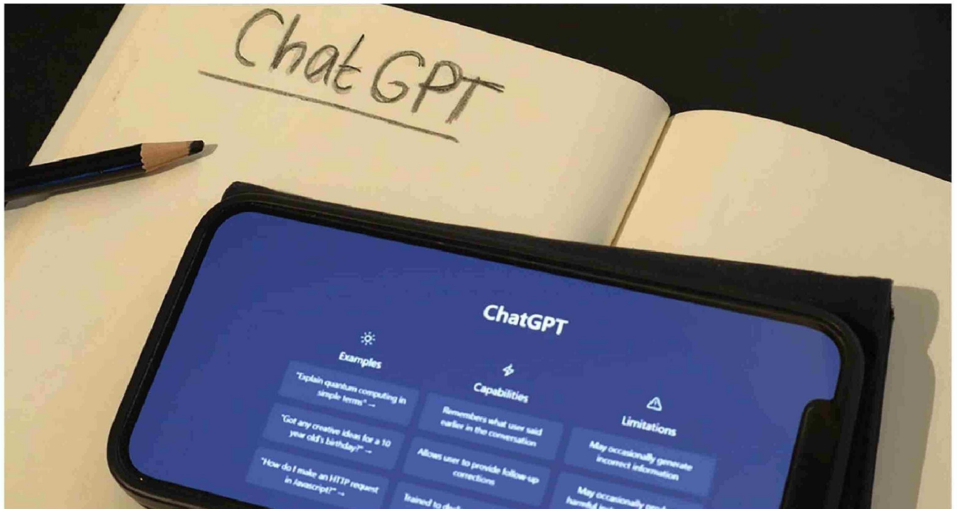
► En EvoAcademy, compañía dedicada a la capacitación en temas de tecnología e IA, puso a esta área a rendir la Prueba de Acceso a la Educación Superior (PAES).