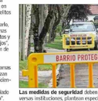
Las medidas de seguridad deben involucrar un esfuerzo mancomunado entre diversas instituciones, plantean especialistas.

Añade que "luego la estrategia debe considerar incentivos económicos para las familias y municipios para la reinserción escolar de jóvenes desahuciados, instalación de 'oficinas de oportunidades laborales' de cooperación público-privada para dar trabajos lícitos a jóvenes y adultos".