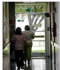
Actualmente, hay 2,5 millones de prestaciones atrasadas.

Otra propuesta, indica Sánchez, es "flexibilizar en forma inteligente la gestión médica para incentivar el trabajo fuera de horarios normales, sujeto a normas e incentivos claros y bien gestionados y supervisados para evitar el abuso", y "resignar más recursos a establecimientos que claramente lo requieren, pero amarrados a cumplimiento de indicadores y metas, sancionando el incumplimiento".