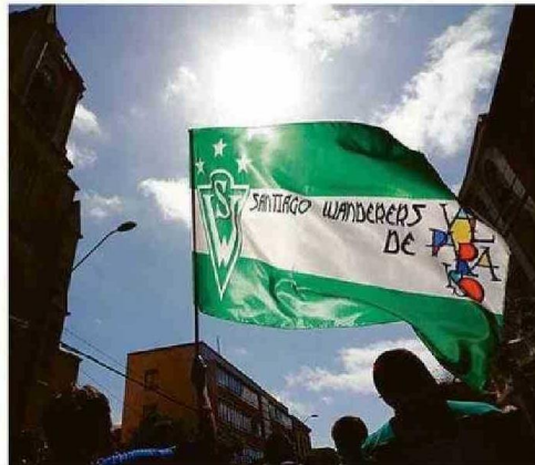
EL DIÁLOGO “VALPARAÍSO Y WANDERERS” ABORDA LA VINCULACIÓN ENTRE LA CIUDAD Y EL CLUB PIONERO DEL FÚTBOL PROFESIONAL