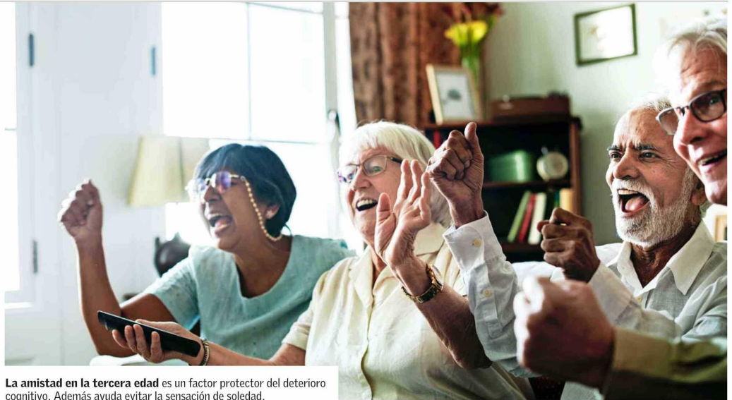
La amistad en la tercera edad es un factor protector del deterioro cognitivo. Además ayuda evitar la sensación de soledad.

E n las 50 ediciones que lleva Mundo Mayor se han dado a conocer distintas historias, voces y aprendizajes que han permitido replantear el envejecimiento, no como un cierre, sino como una etapa en constante evolución.