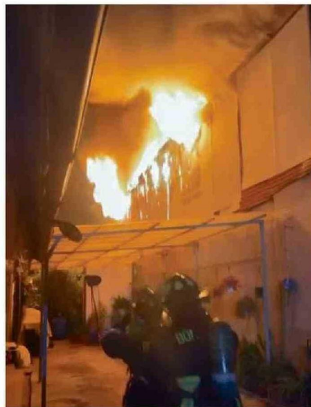
UNO DE LOS VOLUNTARIOS RESULTÓ LESIONADO.