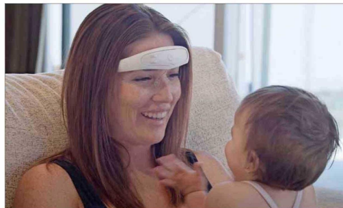
Los nuevos dispositivos de neuromodulación (en la foto) se usan tanto para tratar como para prevenir la migraña. En Chile ya hay uno disponible.

el mundo hay cuatro aprobados y, de esos, en Chile ya tenemos uno, que se inyecta de forma subcutánea una vez al mes, con alta efectividad y una muy buena tolerancia", señala Espinoza. El especialista agrega que este