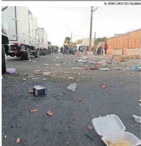
NUEVA ORDENANZA ABORDA EL ASEO EN SECTORES AFECTADOS POR INSTALACIÓN DE FERIAS LIBRES.

Algo más atrás en este proceso de inoculación de la población de los lactantes, figuran las comunas de Antofagasta (79,90%), San Pedro de Atacama (74,70%), Taltal (74,14%), y Sierra Gorda (60%).